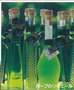
ハーブのリキュール