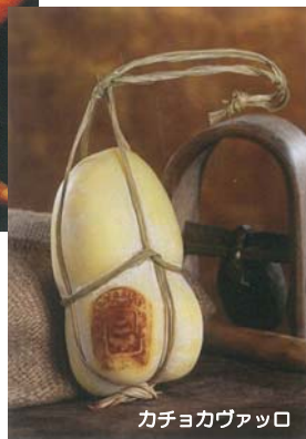
カチョカヴァッロ