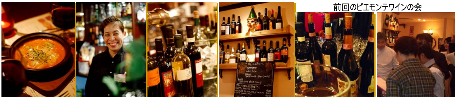
前回のピエモンテワインの会

ヴェネト州はイタリア20州で生産量がトップ、DOC・DOCGの生産量も最多です。 3つの人気あるワインが生産量の大部分を占めます。 ①ヴェローナの東で作られるソーヴェ、②ヴェローナの北アディジェ川北側で作られるヴァルポリチェッラ、③その西側にあるバルドリーノです。 他にコネリアーノとヴァルドツピアーデネの間の丘陵地帯にあるプロセッコが有名。プロセッコの大部分は発泡性のスプマンテで、ヴェネツィアでは食前酒として重宝されています。 また、グラッパ発祥の地といわれているヴェネツィア近郊のバツサーノ・デル・グラッパという村も有名です。