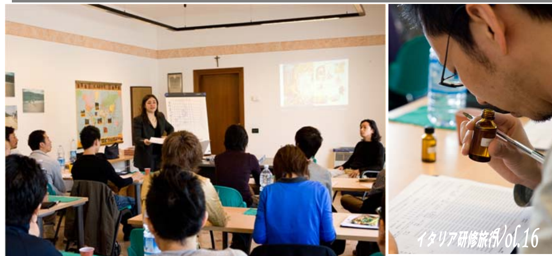
イタリア研修旅行/01.16